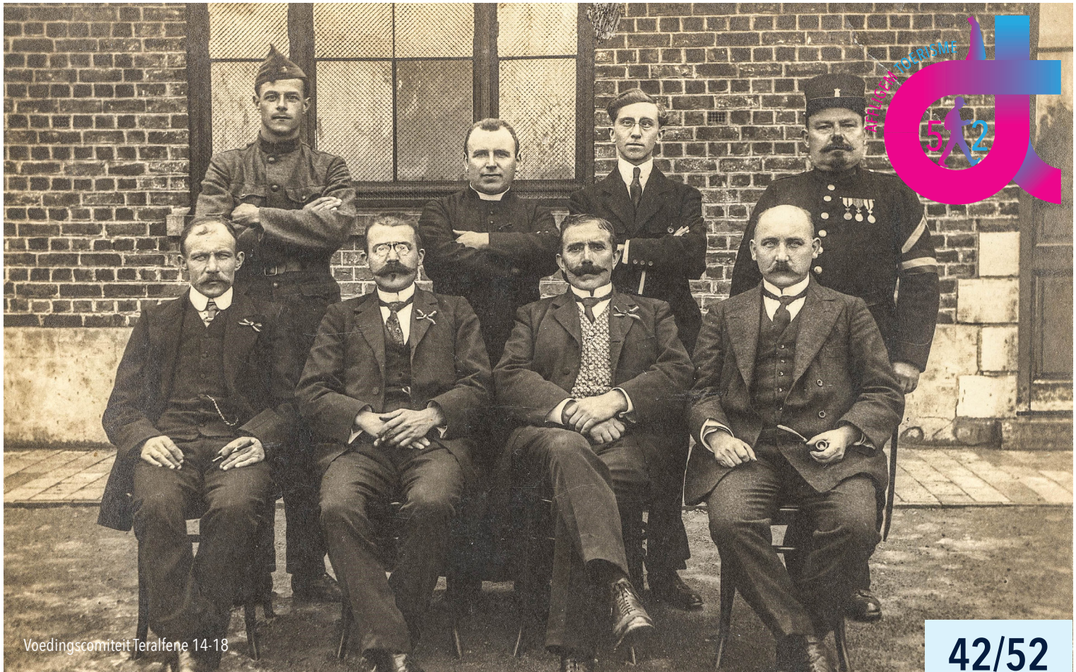
Voedingscomiteit Teralfene 14-18